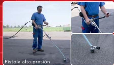
Pistola alta presión